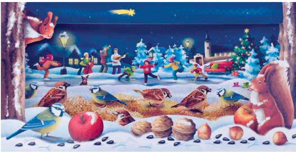
Vánoční pohlednice Věry Tataro