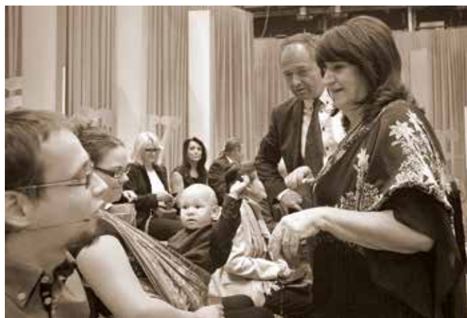
Pomahejs s humorem