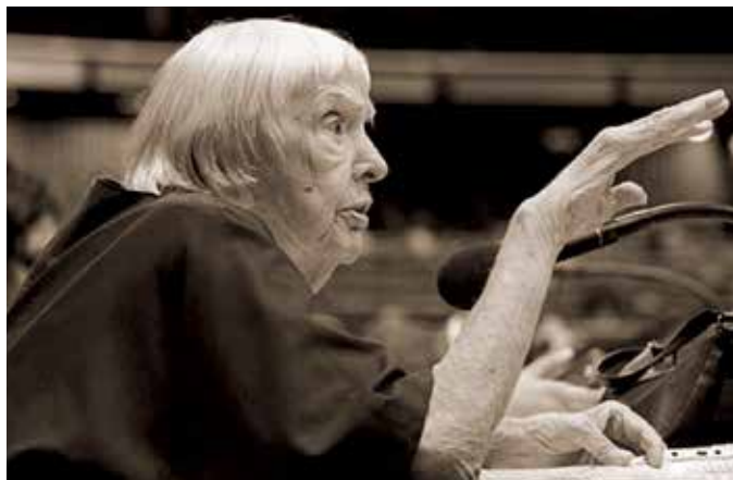
Laureátka Ceny Václava Havla Ljudmila Alexejevová