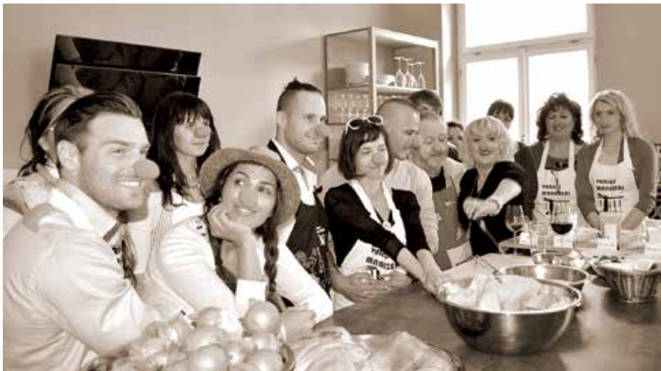
Klaunské nosy Konta Bariéry, Čarodějné vaření