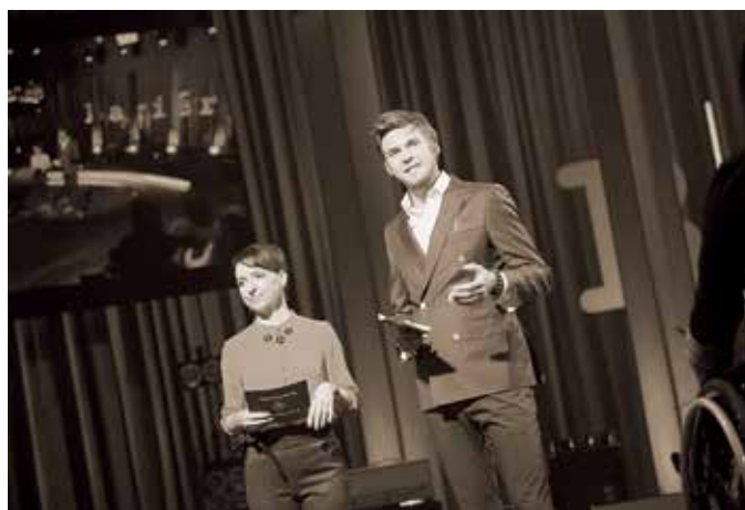
Pomahejs s humorem