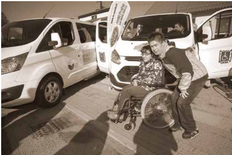
Předání vozů z Fondu Globus v Jindřichově Hradci, 2. listopad