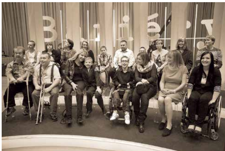
Pomáhej s humorem, 26. září