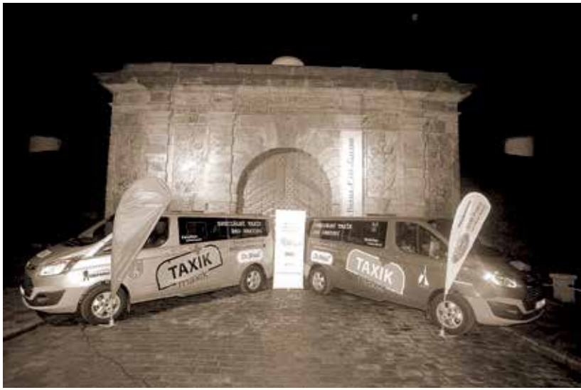
Předání vozů z Fondu Dr.Max v Písecké bráně