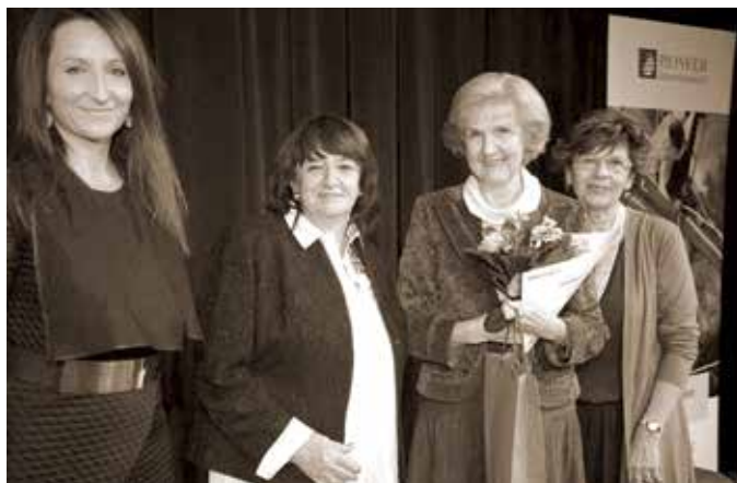
Cena Senior roku 2015, Divadlo v Dlouhé