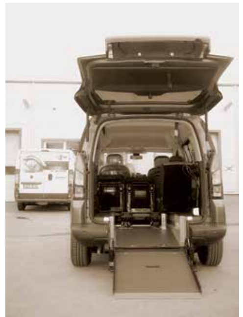
Speciální úpravy automobilů, API CZ