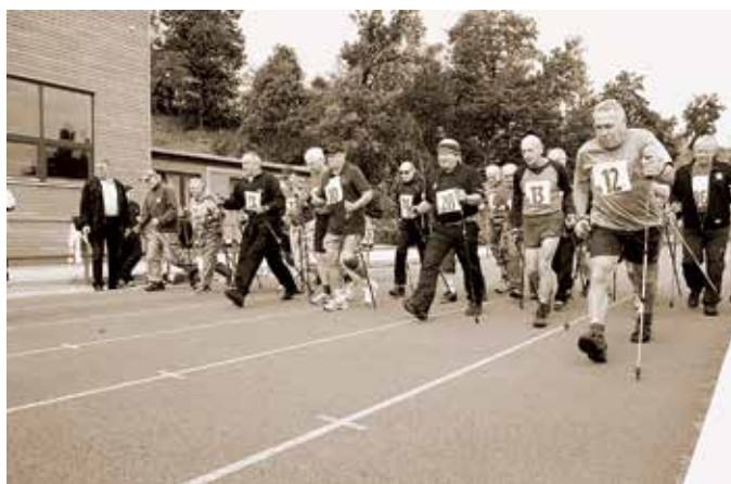
Sportovní hry seniorů, Na Kotlářce