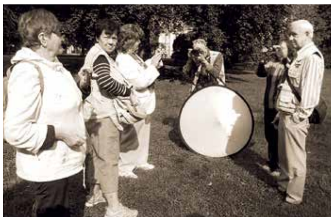
Škola digitální fotografie, Teplice