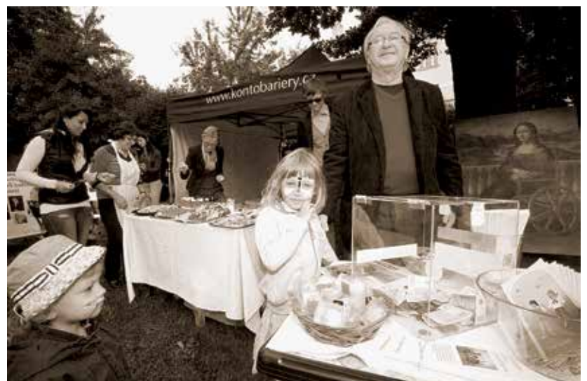
Apetit piknik, 20. červen