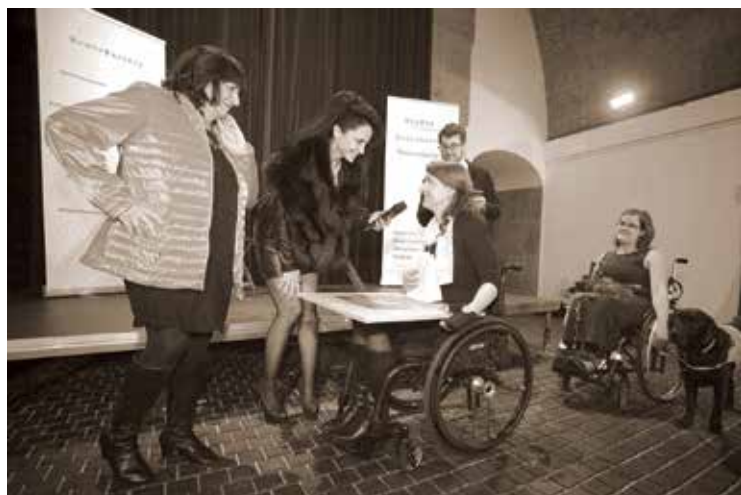
Přátelské setkání, Písecká brána