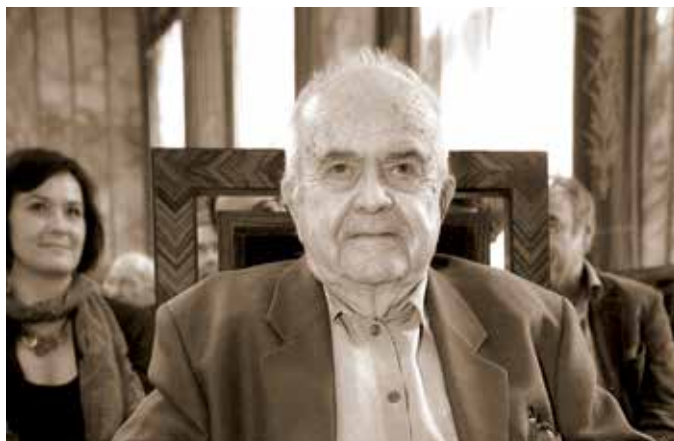
Laureát Ceny Toma Stopparda A. J. Liehm