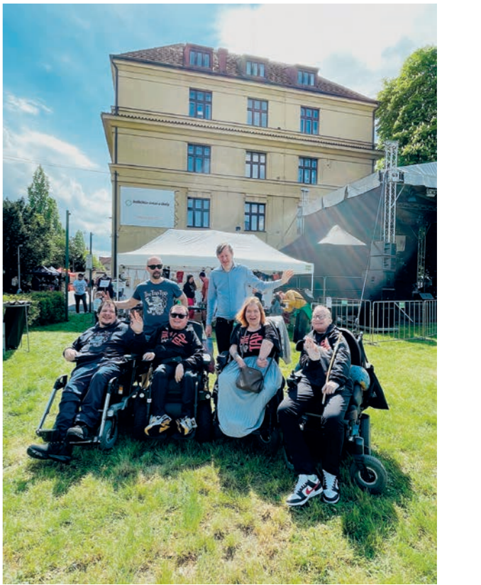
10.ročník festivalu Pojd' dál

Naším cílem je začlenění lidí s handicapem do kulturního života nebo představení jejich dovedností široké veřejnosti. Proto jsme v roce 2022 podpořili dvě kulturní akce celkovou částkou 80 tisíc korun. Jednalo se o 10. ročník festivalu Pojd' dál (prezentace sportovních a kulturních aktivit lidí s různými handicapy) a divadelní inscenaci Jezdci (začlenění neherců s postižením do kulturního života).