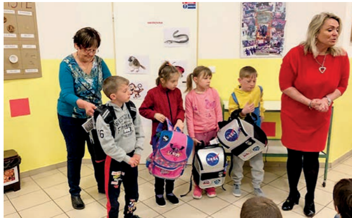
Rozdávání batohů darovaných českou značkou Baagl