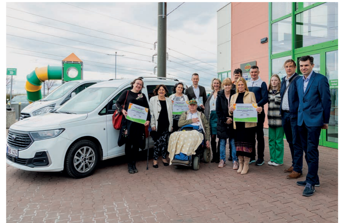
Předání vozů z projektu Globus