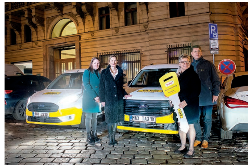
Předání vozů z projektu Taxík Maxík

V podzimním období probíhá kampaň, kdy lékárny řetězce Dr.Max prodávají zboží vlastní značky, z jehož prodeje je určena jedna koruna pro projekt Taxík Maxík. Díky výnosu loňského roku bylo možné zakoupit tři nová vozidla značky Ford (modely Tourneo Connect a Custom) a zároveň přispět na obnovu vozidla městu z prvního ročníku projektu. Taxíky Maxíky jezdí v pětadvaceti městech. K Liberci, Prachaticím, Ústí nad Orlicí, Kutné Hoře, Praze 5, Benešovu, Svitavám, Mostu, Praze 15, Písku, Frýdlantu nad Ostravicí, Českému Těšínu, Český Budějovicím, Vimperku, Havířovu, Šumperku, Orlové, Ústí nad Labem, Čáslavi, Havlíčkovu Brodu, Žďáru nad Sázavou a Praze 7 se v roce 2022 připojila další tři nová města: Město Kravaře, Město Příbram a Město Kralupy nad Vltavou. Vozidla byla městům předána v prosinci 2022 a únoru 2023 a provoz služby byl zahájen v lednu a únoru 2023. Vozidla plánované obnovy uvedla do provozu také města Kutná Hora a Ústí nad Orlicí (ročník 2016).