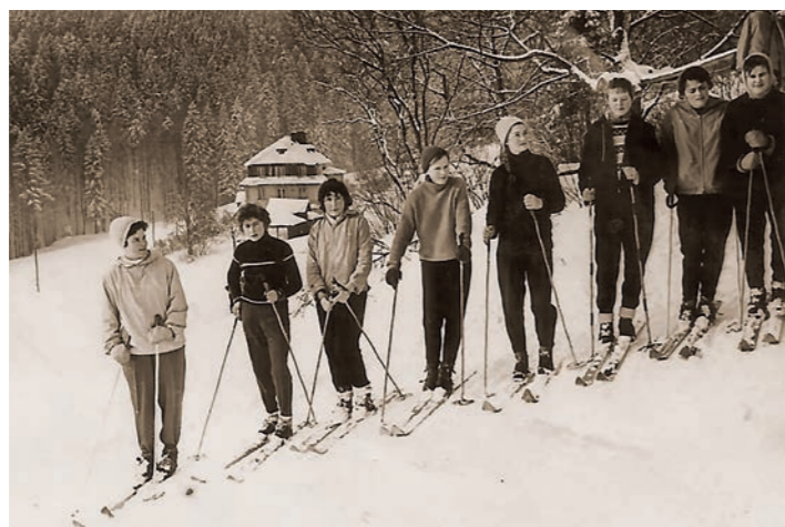
Lyžování s naší třídou v roce 1961