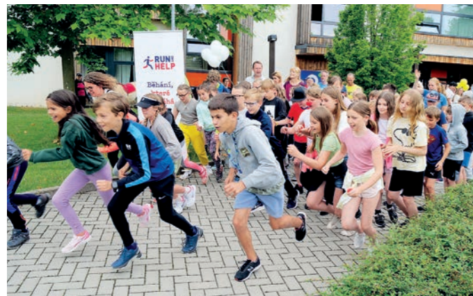
Run and Help v Open Gate