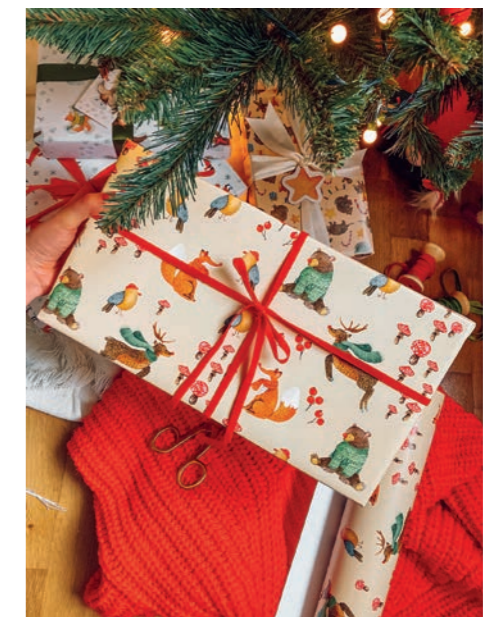
Vánoční papír ePiPi