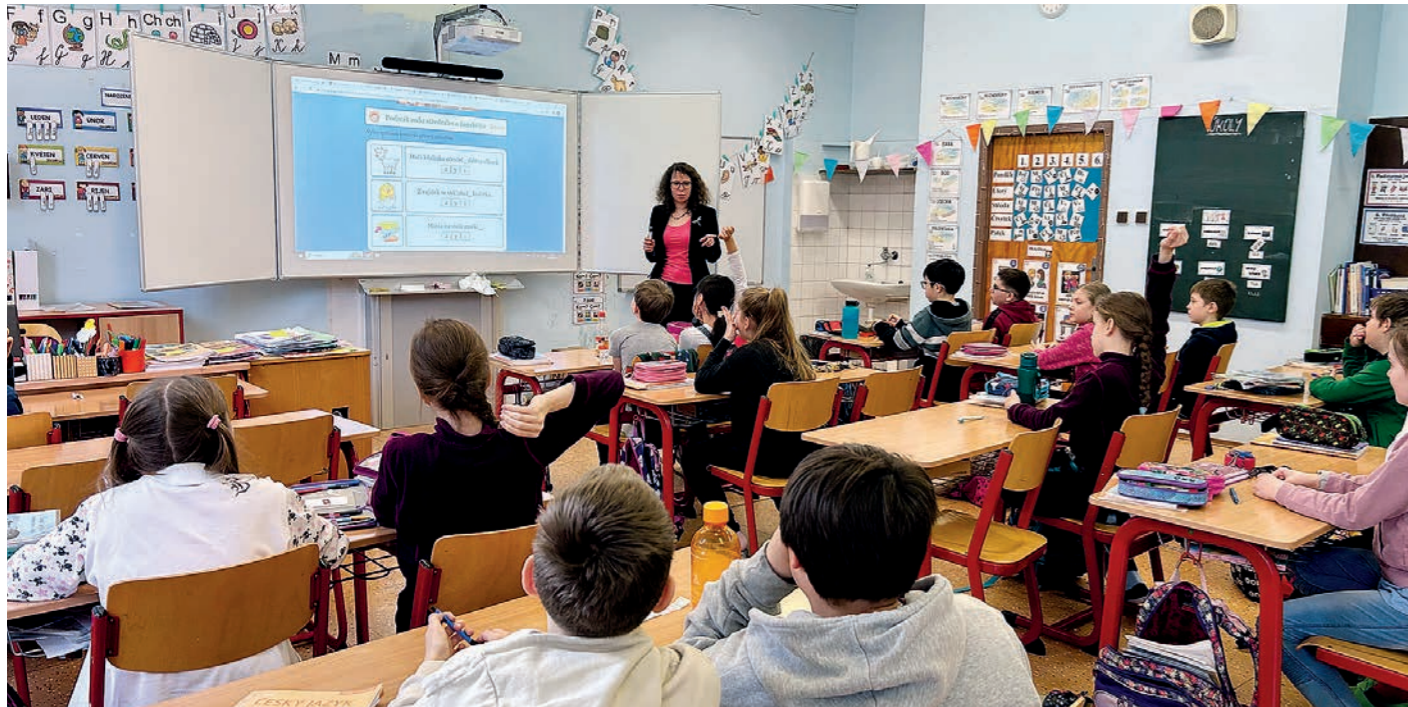
Jedna z podpořených škol - ZŠ Mezi školami

Dva roky po sobě jsme na této straně psali o malém viru, který sužoval naše životy. Těšili jsme se, až pandemie covid-19 odezní a všichni si vydechneme. Místo toho ráno 24. února 2022 zaútočilo Rusko na Ukrajinu a jen několik set kilometrů od našich hranic vypukla válka, kterou si nikdo z nás nedokázal představit.