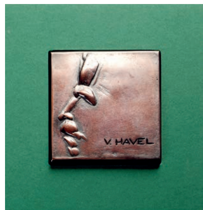
Plaketa Václava Havla