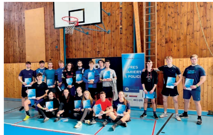
Přes bariéry s policií