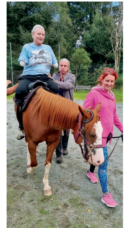
Nezdolná paní Eva

Rok 2022 jsme zakončili milou spoluprací s českým ilustrovaným papírnictvím ePiPi , které pro Konto Bariéry vytvořilo originální vánoční balicí papír. Jeho prodej vynesl 41 400 korun pro lidi s handicapem.