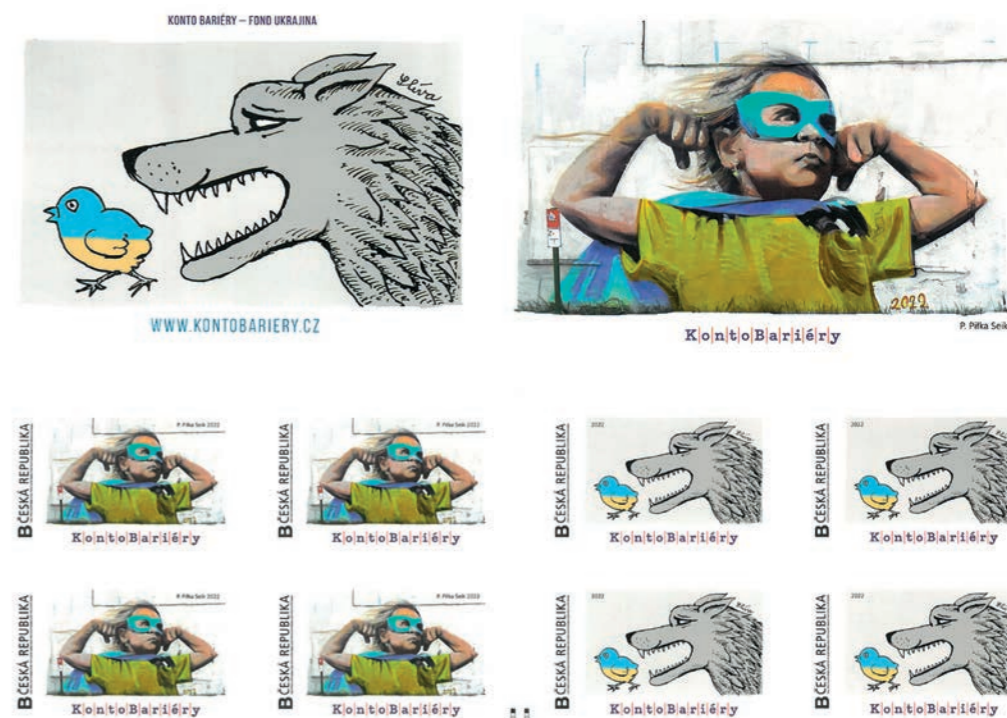
Známkový sešitek Soucit a vzdor

Známky je možné si objednat na: znamka@bariery.cz