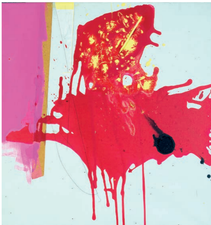
Vladimír Kopecký, Vztek, 2021