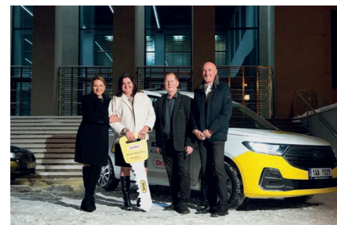
Předání vozů z projektu Taxík Maxík

Ford (modely Grand Tourneo Connect) a zároveň přispět na obnovu vozidla městu z prvního ročníku projektu.