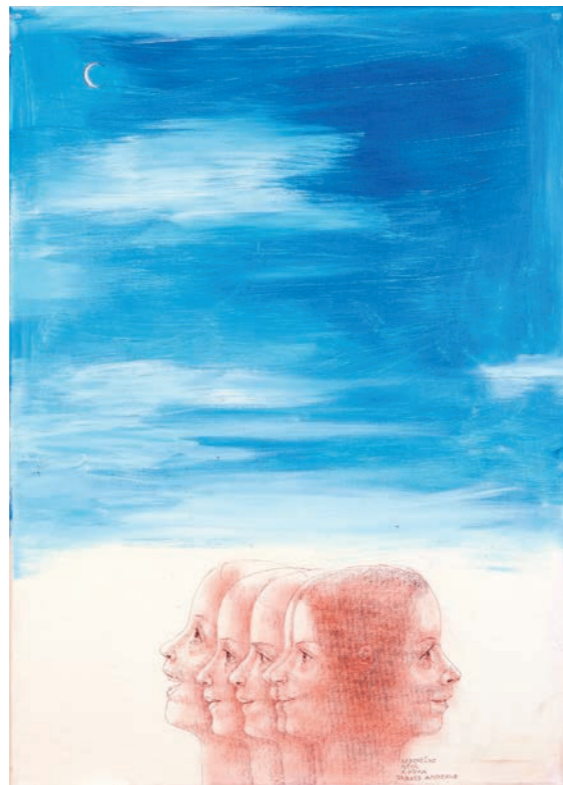
Jiří Anderle, Nekonečno, měsíc a dívka, 1977/2023